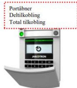
Betjeningspanel med LCD og prox