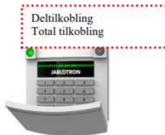
Betjeningspanel med prox læser